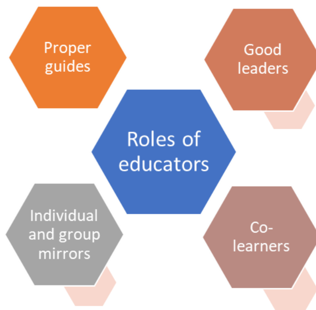
Figuur 1. Rollen van opvoeders in de online leeromgeving

Tijdens een pandemie kwamen de meeste mensen verschillende uitdagingen tegen. Waarschijnlijk een van de grootste invloeden en veranderingen werden ervaren door opvoeders. Vanuit klaslokalen en live activiteiten moest hun werk overgebracht worden naar de online omgeving. Volgens de verschillende enquêtes kreeg de meerderheid van de opvoeders te maken met verschillende uitdagingen bij het overschakelen naar online lesgeven. Bijvoorbeeld het gebrek aan digitale competenties, het niet vasthouden van de aandacht van de leerling, enz. Om deze problemen op te lossen, moesten opvoeders daarom hun rol en gedrag veranderen tijdens het geven van lessen, trainingen, cursussen, enz. Dus, welke rollen moeten opvoeders hebben, en hoe moeten ze zich gedragen tijdens het lesgeven in de online omgeving?