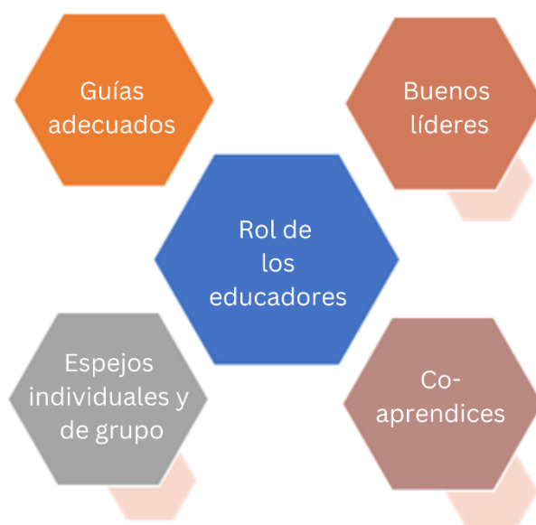
Figura 1. Funciones de los educadores en el entorno de la enseñanza en línea

Durante una pandemia, la mayoría de las personas se enfrentan a diferentes retos. Probablemente una de las mayores influencias y cambios la experimentaron los educadores. De las aulas y las actividades en directo, su trabajo tuvo que trasladarse al entorno en línea. Según las diferentes encuestas, la mayoría de los educadores se enfrentaron a diversos retos al pasar a la enseñanza en línea. Por ejemplo, la falta de competencias digitales, la imposibilidad de mantener la atención del alumno, etc. Por lo tanto, para resolver estos problemas, los educadores tuvieron que cambiar su papel y su comportamiento a la hora de impartir clases, formación, cursos, etc. Así pues, ¿qué funciones tienen los educadores y cómo deben comportarse mientras enseñan en el entorno en línea?