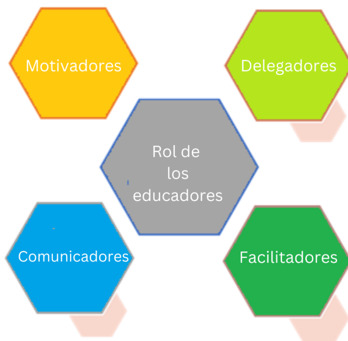
Figura 3. Funciones de los educadores en el entorno de la enseñanza combinada

Además, Geeta Rani et al. divide el papel de los educadores de una manera diferente, como se muestra en el siguiente gráfico: